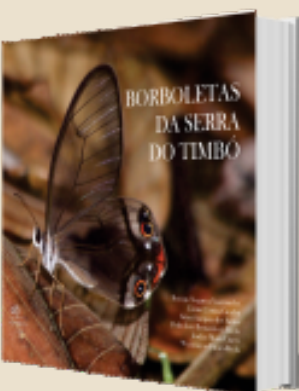
2015 / 213 p. / 15,5 x 21,5 cm ISBN: 978-85-99799-95-6

Além de servir como material didático-pedagógico para aulas de Zoologia em diversos níveis acadêmicos, o livro é um convite aos pesquisadores a fim que intensifiquem esforços para melhor conhecer os padrões ecológicos da fauna do Nordeste brasileiro na perspectiva de conservação de sua biodiversidade.